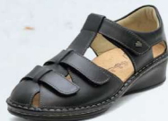
014099 SS ブラック 2-6% ㊤