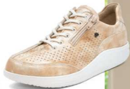
357006 SS ベージュエナメル 2-7½ ®

Fin. Copyright Shoes Catalog 2023 FINNAMIC Collection