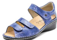
357518 ES ブルーエナメル 2-6½ ㊞