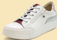
902906 SS ホワイト/ボルドー/シルバー 2-7 ®