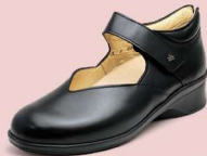
014099 ブラック 2-6½ ㊤