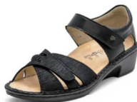
902890 SS ブラックプリント/ブラック 2-6% ㊤