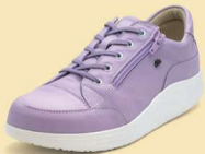
799119 SS ライラック 3-6½ ®