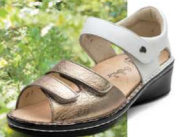
902735 ES ゴールド/ホワイト 2-6½ ㊞