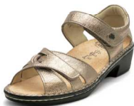
517222 SS ゴールド 2-5% ㊤