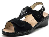
007099 SS ブラックヌバック 2-6 ㊤