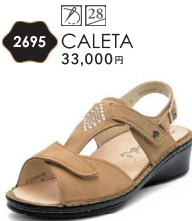
007499 SS タンヌバック 2-5% ㊤