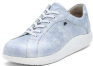
821375 SS ナチュラルマーレ 2½-6½ ㊞