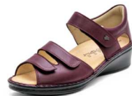
604391 ES ボルドー 2-6½ ㊞