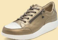
902940 SS ダークベージュパール/ラテ 2-6½ ®