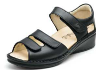
014099 ブラック 2-6½ ㊞