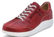
604420 SS レッド 2-6½ ®