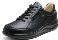
001099 ブラック 2-9 ®