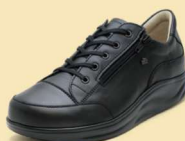
014099 ブラック 2-9 ®