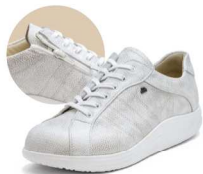
821081 SS ナチュラルトープ 2-7 ㊞