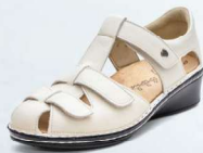
471517 SS ラテ 2-6% ㊤