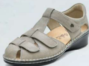
825081 SS トーププリント 2-6% ㊤