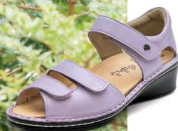
604108 ES ローズ 2-6½ ㊞