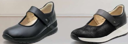
902726 ES ブラックストレッチ/ブラック 3-6%®