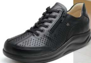
001099 SS ブラック 2-9 ®