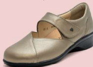
410189 ES ダークベージュパール 2-6 ㊤