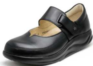
014099 ブラック 2-6½ ㊞