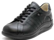
001099 ブラック 2-9 ㊞