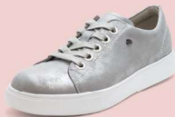
640297 ES シルバー 3-6½ ㊤