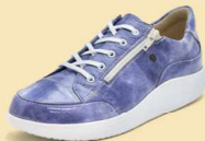
357518 SS ブルーエナメル 2-7 ®