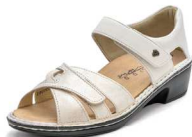
902898 SS ゴールドプリント/ラテ 2-6% ㊤