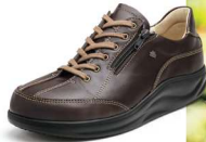
239023 カフェ 2-9 ®