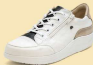
902905 SS ホワイト/ブラック/ゴールド 2-7 ®