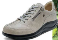
825081 SS トーププリント 2-7 ®