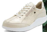
902945 SS ラテ/ゴールドプリント 2-7½ ®