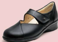
014099 ブラック 2-6½ ㊤