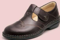
239023 カフェ 34-40 ㊤