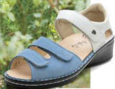
902748 ES ブルームバック/ホワイト 2-6½ ㊞