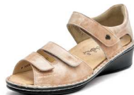
357006 ES ベージュエナメル 2-6½ ㊞