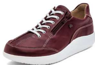
604391 SS ボルドー 2-6½ ®