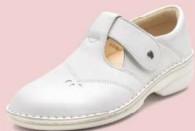
001000 ES ホワイト 34-39 ㊤