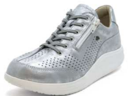
640297 SS シルバー 2-6½ ®