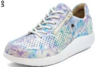
791214 SS スカイ 2-7 ®